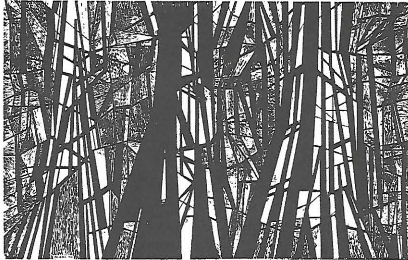
45 - Vinicio Bertini: Realtà totale , 1951. tecnica mista, cm. 200 x 125.