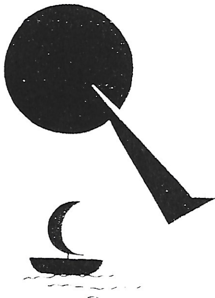
In alto a destra: Piet Mondrian, composizione serigrafica da un olio del 1930 In basso a destra: Wassily Kandinsky, composizione originale del 1924 In basso a sinistra: Galliano Mazzon, tempera del 1939